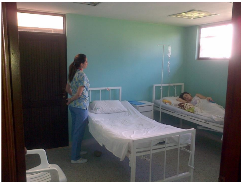
CENTRO DE ATENCION DE LEJANIAS

“La E.S.E departamental “solución Salud” del Meta, de primer nivel de complejidad, ofrece servicios de promoción y prevención de enfermedades y atención en salud con un enfoque diferencial de forma eficiente, confiable, segura y rentable, a través de un equipo ético, humano y competente, capaz de brindar una atención amable, eficaz y oportuna, contando con la infraestructura, tecnología e insumos para garantizar la atención y satisfacción a los usuarios; fortaleciendo el mejoramiento continuo, la solidez y rentabilidad financiera para mantener su compromiso social”.