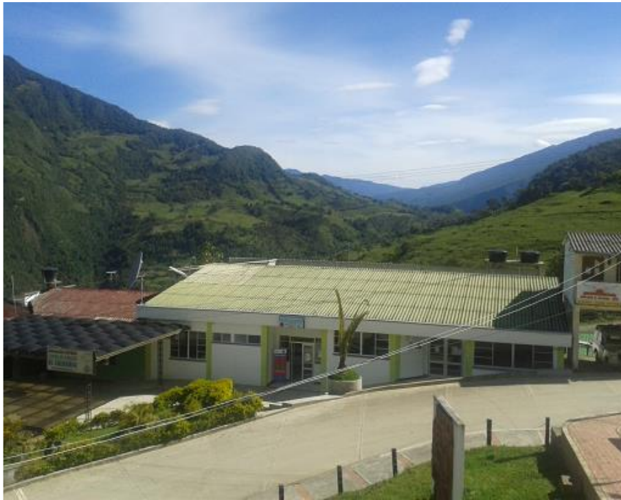
CENTRO DE ATENCION DEL CALVARIO

“La ESE DEPARTAMENTAL “SOLUCION SALUD” en el 2016, será una empresa modelo de liderazgo en la prestación de servicios de salud de primer nivel de complejidad, competitiva tanto tecnológicamente como en Recurso Humano, donde el personal garantice y satisfaga las necesidades básicas del servicio de Salud, con calidad, Calidez y con sostenibilidad financiera con una alto porcentaje de satisfacción en sus usuarios”.