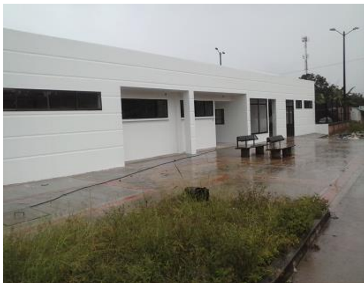
CENTROS DE ATENCION BARRANCA DE UPIA

Los hospitales locales, centros y puestos de salud de primer nivel de atención de los siguientes 17 municipios no certificados: