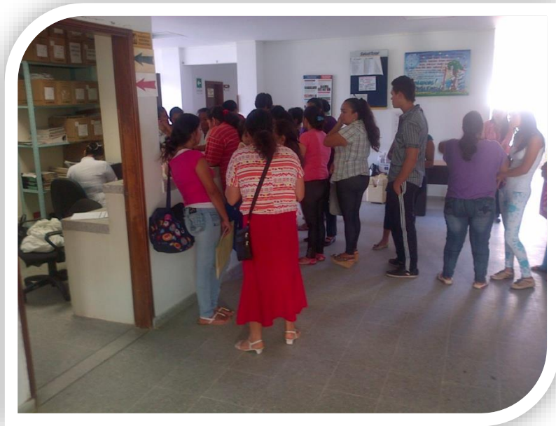
CENTROS DE ATENCION DE LEJANIAS

Prestar servicios de primer nivel de atención en salud entendidos como un servicio público a cargo del estado y como parte integrante del sistema general de seguridad social en salud. En desarrollo de este objeto, contratará y adelantará acciones de promoción y prevención, tratamiento y rehabilitación de la salud.