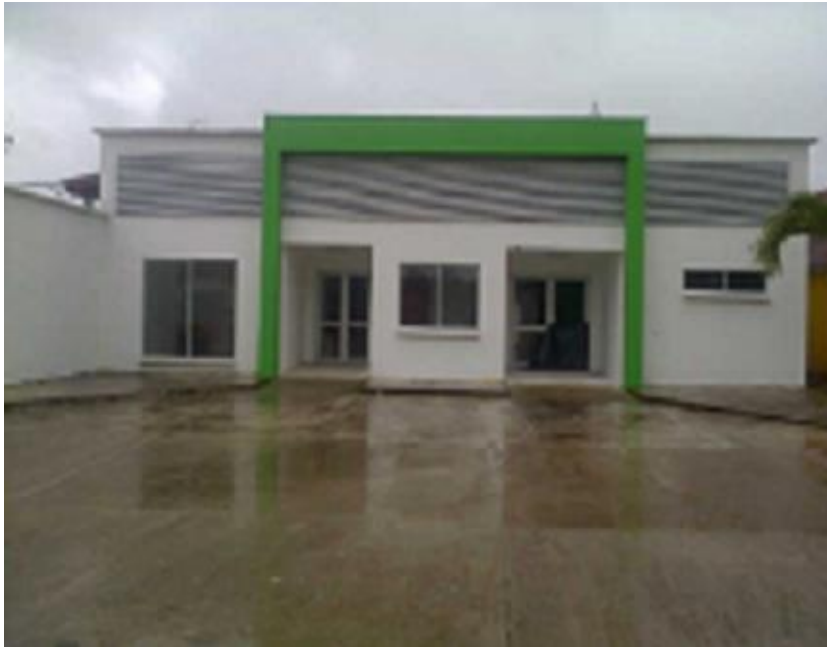
CENTRO DE ATENCION DE LA URIBE

En su planeación la gerencia plantea como objetivo general: “Prestar el servicio de salud en condiciones de calidad, mejorando la oportunidad, el acceso y la eficiencia e implementando la política de humanización durante los próximos cuatro años”.