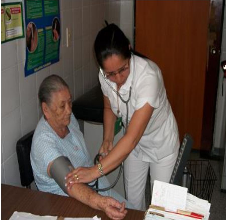
CENTROS DE ATENCION DE RESTREPO

“Brindar una atención integral, oportuna y humanizada en salud, para satisfacer las necesidades de nuestra población rural y urbana, ofreciendo un enfoque diferencial preventivo con énfasis en la promoción de la salud, actuando con ética, responsabilidad, compromiso y transparencia, enfocada al beneficio de nuestros usuarios”.